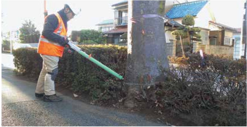
立木の根返り倒伏の危険度の高い根株内腐朽調査